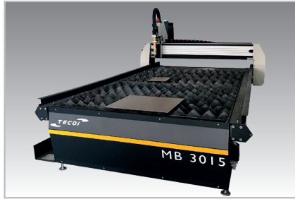
Model 3015 Modelo 3015

Without a doubt, the MB model is the perfect solution for low and average production lines. With this model, TECOI is strengthening its leadership in the manufacture of cutting machines with the best performance on the market.