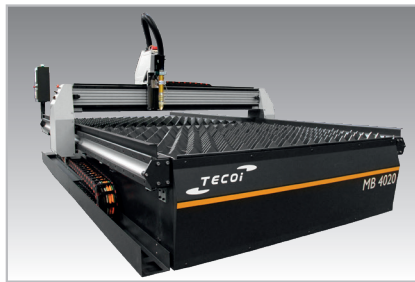
Model 4020 Modelo 4020